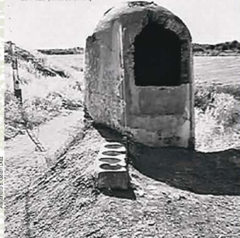
La Poza (finales S. XX)

Este enclave rural, fundamental para conocer la historia cotidiana de Fuente Palmera se ha restaurado y en la actualidad luce una cúpula de ladrillo encalada que cubre el brocal y seis cantareras. Con la imaginación el paseante aún puede intuir el frescor de la sogá mojada, el rumor del agua en las cantareras y el paso de las bestias sobre el empedrado del arroyo de La Plata Chica. El agua vuelve a ser protagonista y testigo de la historia de la Colonia de Fuente Palmera y sus gentes.