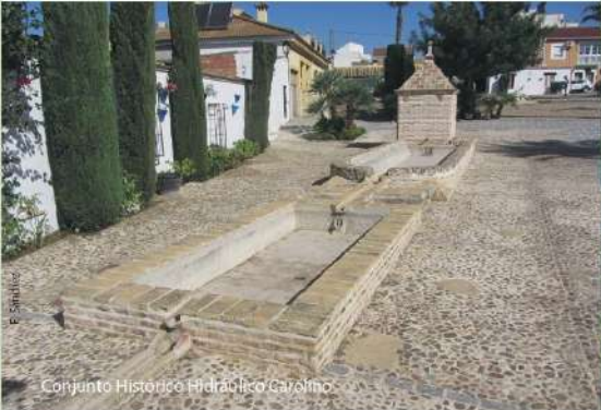
Conjunto Histórico Hidráulico Carolino