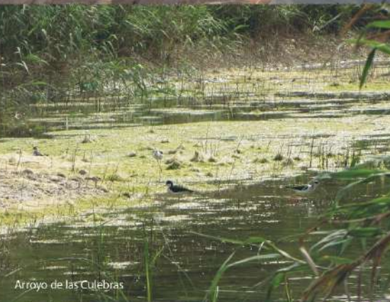
Arroyo de las Culebras